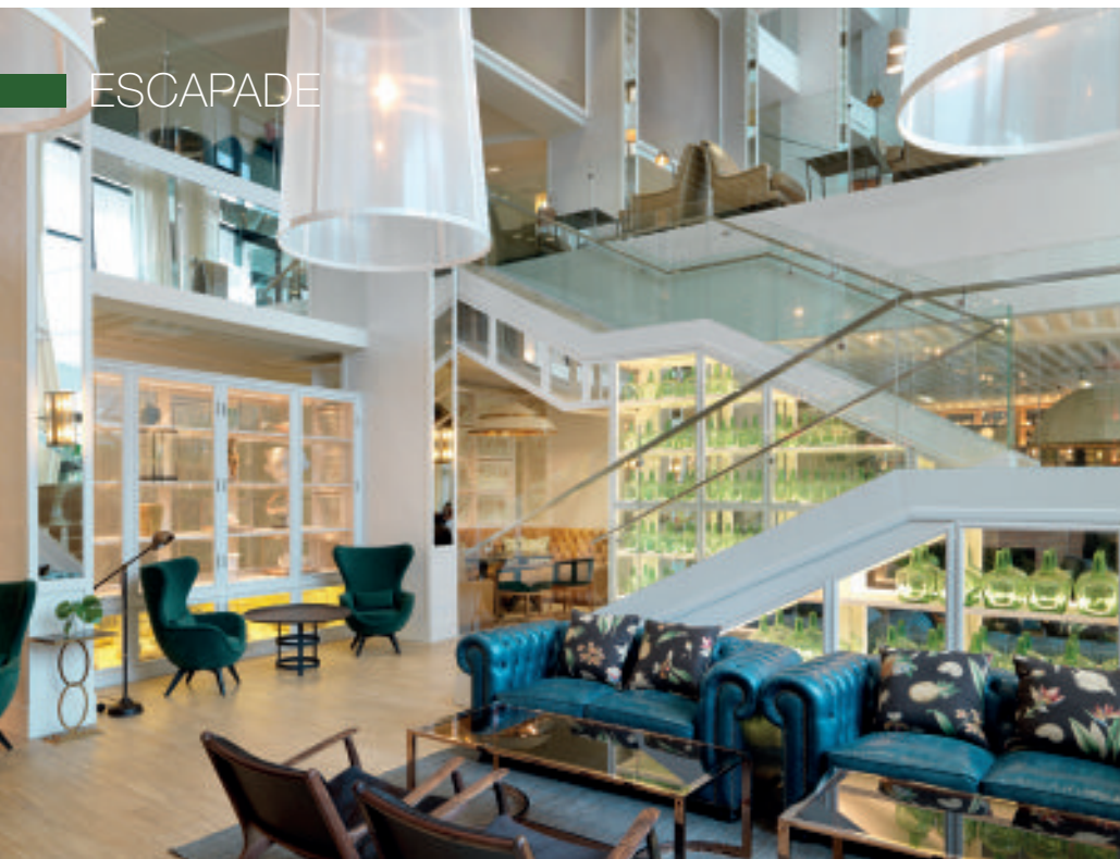
Les généreux espaces de l'Hôtel Camiral 5*, le nouvel établissement chic et design du resort.