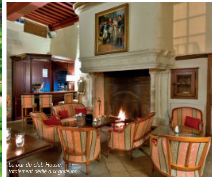
Le bar du club House, totalement dédié aux golfeurs.