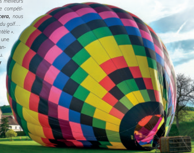
Vol en montgolfière à la découverte d'Armançon en Auxois.