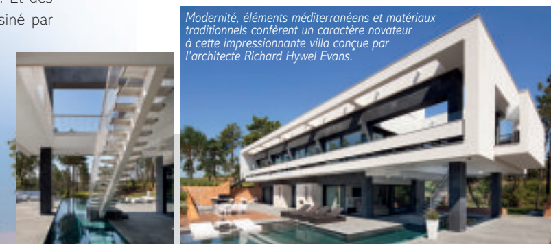
Modernité, éléments méditerranéens et matériaux traditionnels confèrent un caractère novateur à cette impressionnante villa conçue par l'architecte Richard Hywel Evans.