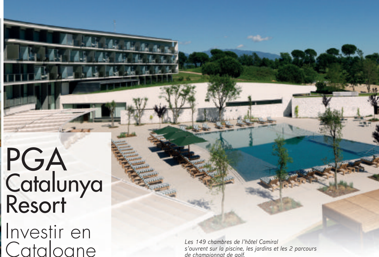
Les 149 chambres de l'hôtel Camiral s'ouvrent sur la piscine, les jardins et les 2 parcours de championnat de golf.