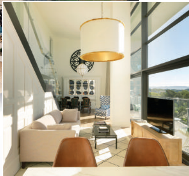
Bain de lumière pour l'Executive Suite signée du talentueux designer catalan Lázaro Rosa-Violán.

A rriver à Barcelone. Vouloir jouer au golf, vivre, investir, et profiter de la meilleure destination catalane ? Bienvenue à PGA Catalunya Resort ... Là, où la pluralité géographique et culturelle exulte. Enclavés dans un paysage à la beauté fascinante, s'offrent deux parcours de 18 trous hautement premium, un ensemble immobilier conçu par une équipe d'architectes primés, et la découverte d'un hôtel ouvert sur la nature. Séduisant ! En prime, à un jet de pierres, Púbol, petit village médiéval où Dali offrit un château à Gala, intime et secret, totalement fantasque avec sa garde-robe Dior/Lanvin exposée, et sa tombe veillée dans une crypte par une girafe, deux chevaux et un lapin. Incontournable, le Girona Food Tour , l'itinéraire gourmand à s'offrir au cœur de Gérone.