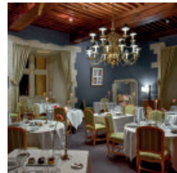
Le restaurant gastronomique L'Armançon